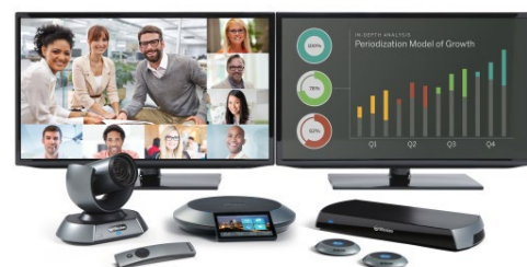
Lifesize® Icon600™ avec sa configuration à deux écrans en option pour le partage des données, Lifesize® Camera 10x™, plus les Lifesize Digital MicPods attachés au Lifesize Phone HD pour les grands espaces.

*Non applicable avec Lifesize® Icon 400™ et Lifesize® Icon 450™