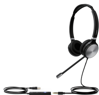
UH36 Dual Teams UH36 Dual UC